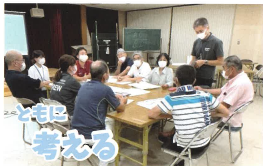
座談会(西富山・藤岡地域座談会の様子)

市内を12圏域に分けた座談会を設置しており、それぞれの地域課題や特性に応じた地域福祉活動を創出していきます。座談会の活動に興味・関心がありましたら四万十市社協までご連絡ください。