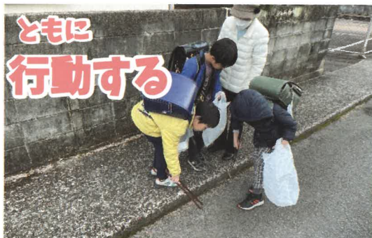
おはボラ(ゴミを拾いながら登校する児童)