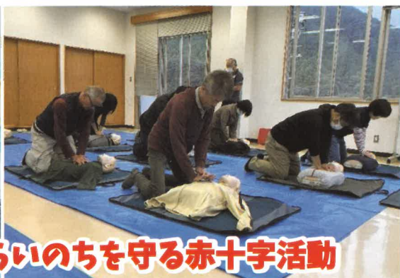
災害からいのちを守る赤十字活動