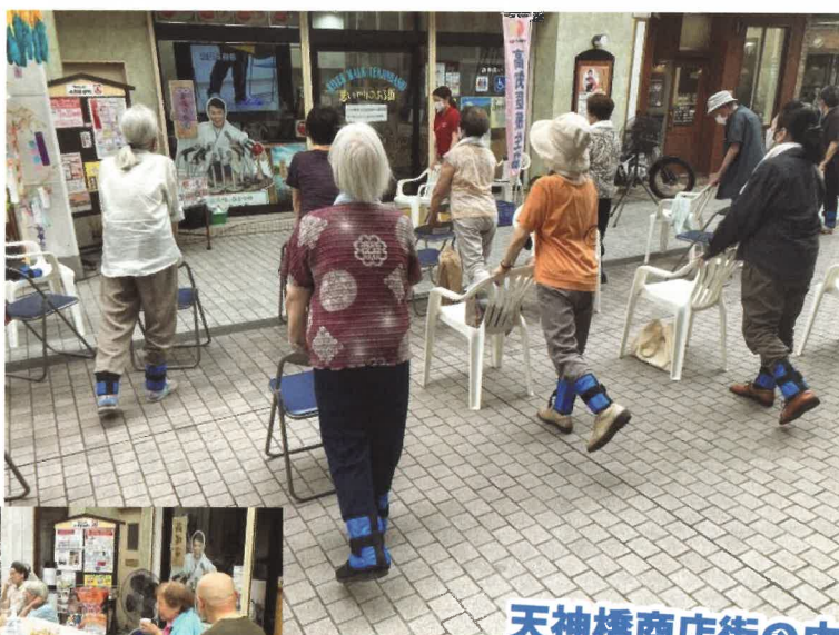
天神橋商店街の中