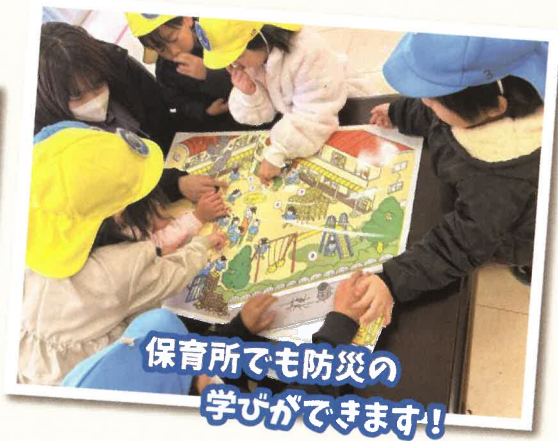
保育所でも防災の学びができます！