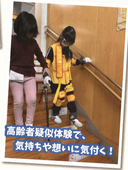
高齢者疑似体験で、気持ちや思いに気付く！