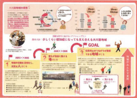
大川筋地域で作成を進めるアクションプラン