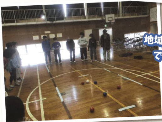
地域でできることを実践する！

福祉教育の推進は、小・中学校、高校ではもちろんのこと、地域のつどいの場や企業の取り組みでも実施しています。興味関心のある方はご連絡をお待ちしています。