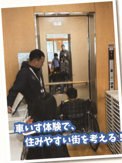
車いす体験で、住みやすい街を考える！