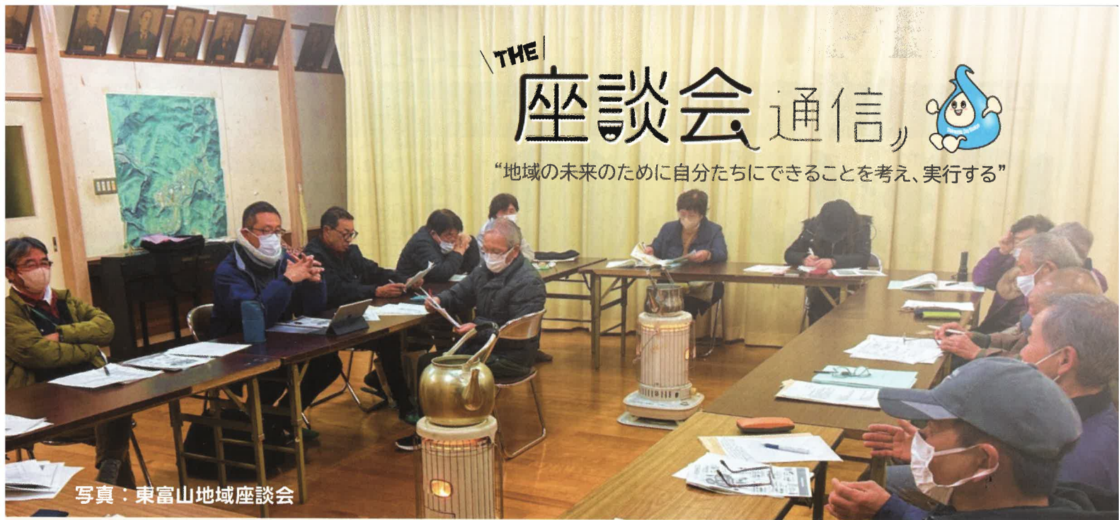
写真：東富山地域座談会