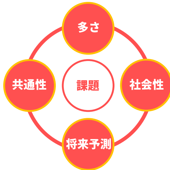
図表 2 個別課題を地域課題に転換する4つの視点

複雑かつ複合的な課題を有する方(世帯)の支援をするには、事例検討の段階から、事例の背景にある課題の多さ、共通性、将来予測、社会性といった視点から、個別課題を地域課題へ転換し、事業化や政策化により社会資源を発展させていく必要があります。そして、それを継続的に実施していくことで、地域課題の解決が進んでいきます。(図表 2)