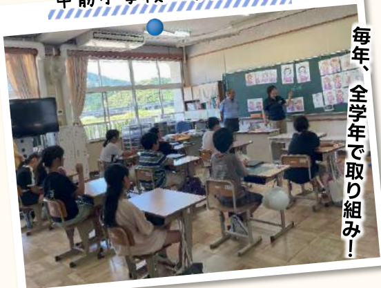
中筋小学校×手話学習