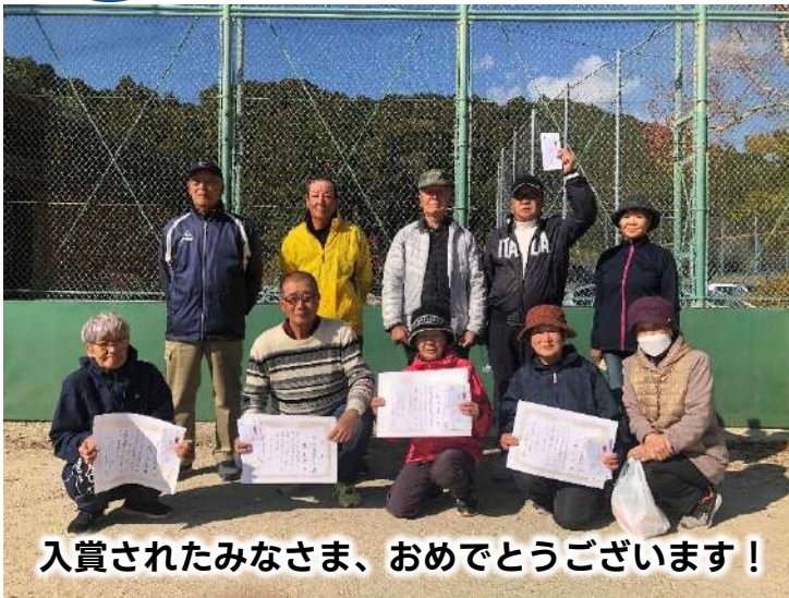
入賞されたみなさま、おめでとうございます！

令和6年12月17日(火)、安並グラウンドにて四万十市老人クラブ連合会グラウンドゴルフ大会を開催、51名の方が参加されました。まだ肌寒い朝9時からのスタートでしたが、みなさん寒さを感じさせないパワー溢れるプレイで、「ナイスー！」や「惜しい」と声掛けをしながら楽しむことが出来ました。