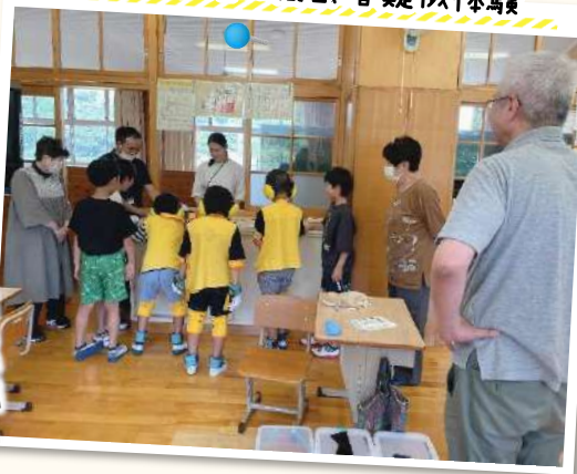
八束小学校×高齢者疑似体験