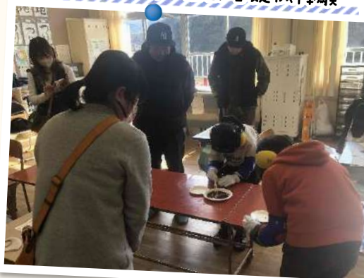
蕨岡小学校×高齢者疑似体験