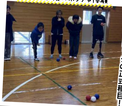
利岡小学校×ポッチャ体験