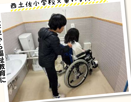
西土佐小学校×車いす体験