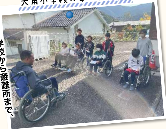
大用小学校×車いす体験