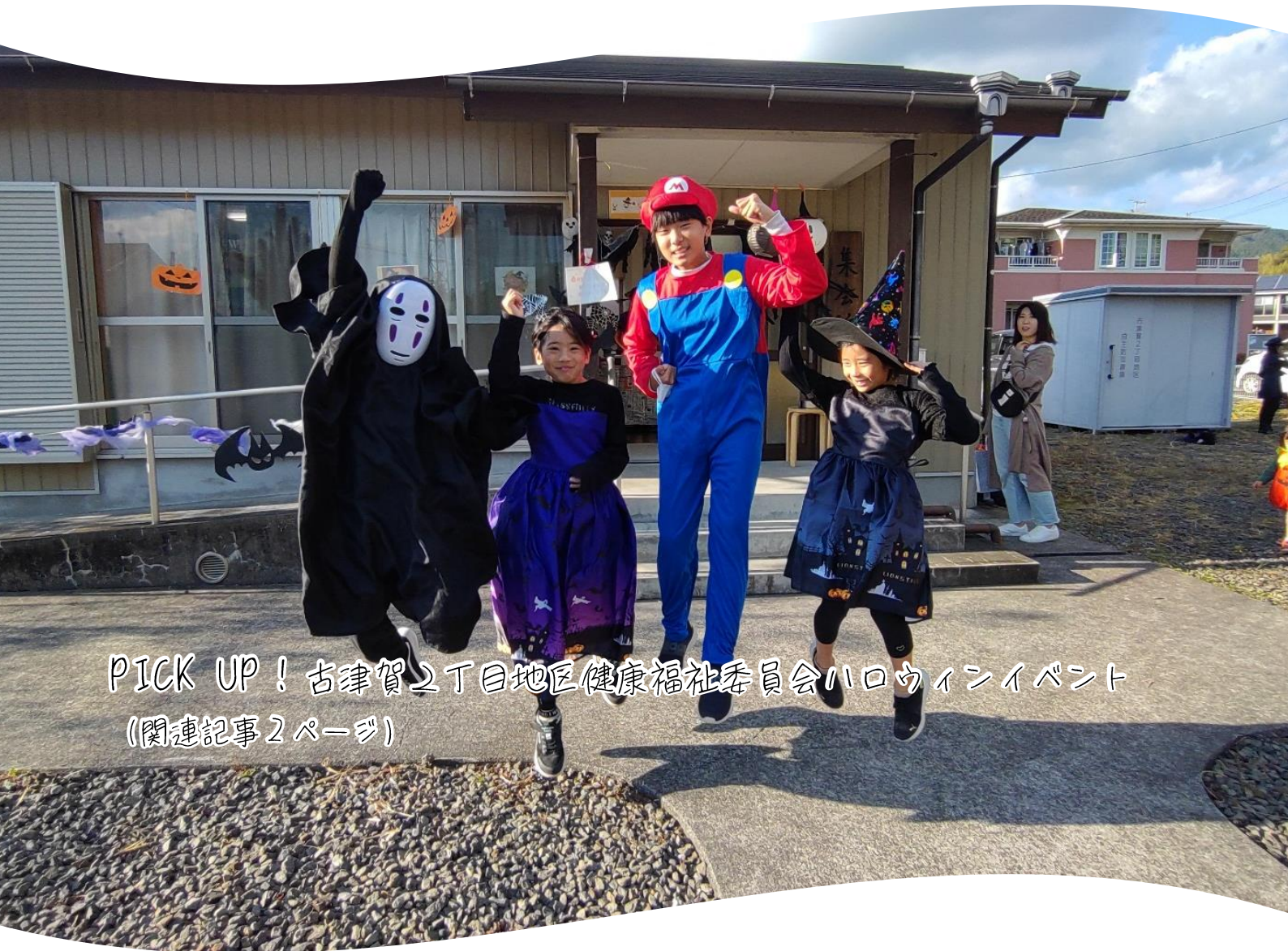
PICK UP! 古津賀2丁目地区健康福祉委員会ハロウィンイベント (関連記事2ページ)