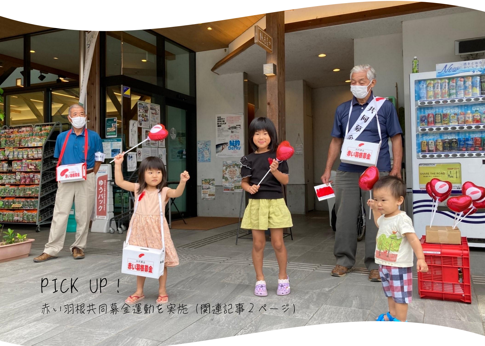
PICK UP! 赤い羽根共同募金運動を実施 (関連記事 2 ページ)