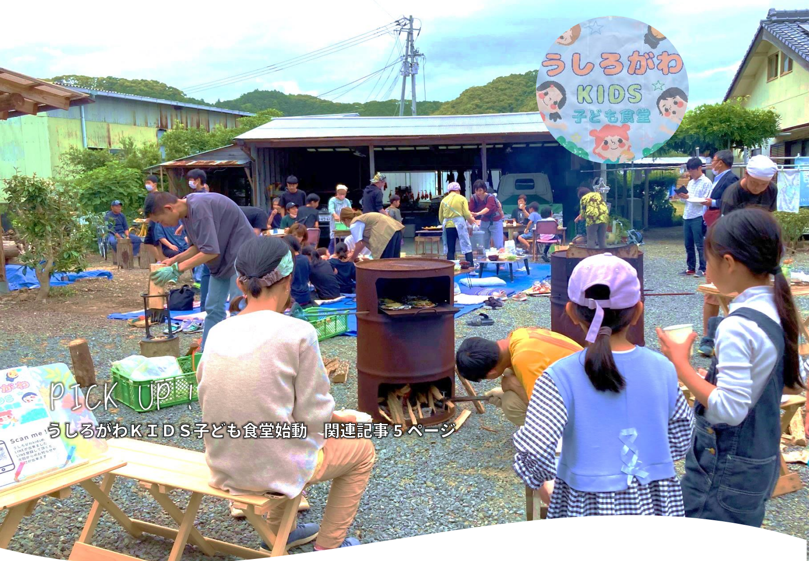
PICK UP! うしろがわ KIDS 子ども食堂始動 関連記事 5 ページ